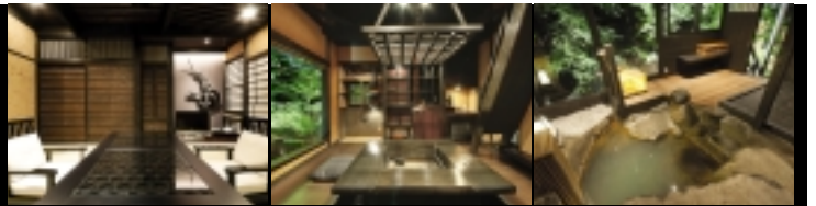
■ お部屋のレイアウト